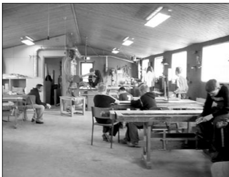
Her ses nogle elever i i sløjdlokalet på Nordborg Slot.