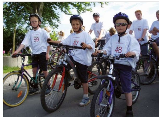
Tre friske drenge venter på startskuddet.

Vi vil gerne sige tusind tak til vore mange sponsorer, forældre, bedsteforældre, forretningsdrivende, ja til enhver der har sponsoreret en af vores mange cyklende børn, og voksne denne dag.