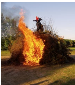
Heksen var på plads, da det flotte bål skulle tændes.

Skt. Hans-festen var noget af et tilbedsstykke – vi var ca. 250 personer samlet til en hyggelig aften.