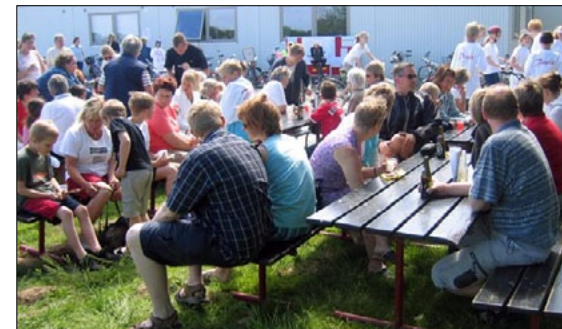
Fælles hygge på plænen foran skolen.

Søndag den 29. maj blev der igen afholdt Tour De Østerlund. Dagen startede kl. 11.00, med solskin og højt humør. Ca. 100 personer havde skaffet sig sponsorer, og cyklede penge hjem iført T-shirt sponsoreret af Danfoss.