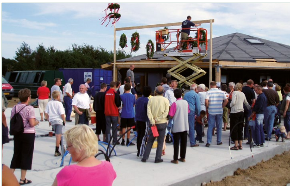
De sidste kranse bliver hængt på plads over vores nye skole, som vi glæder os rigtig meget til at tage i brug.

Jeg vil slutte med at ønske alle elever, forældre og medlemmer af Støtteforeningen rigtig glædelig jul og et godt nytår.