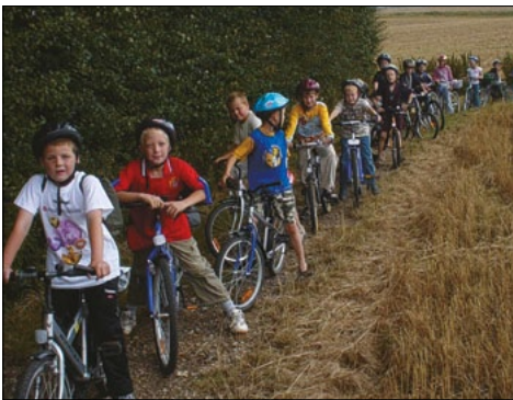
Eleverne på vej til lejrskoleophold.