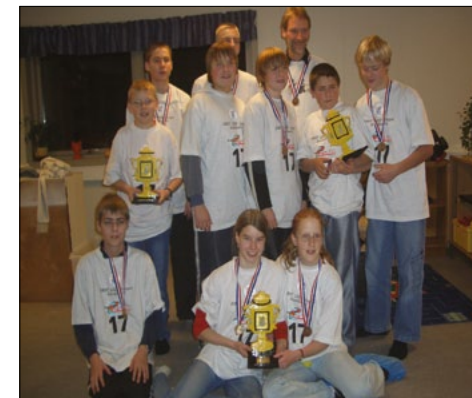
Hell Robots teamet viser her stolt deres pokaler frem.

Igennem efteråret har 11 børn fra skolen forberedt at skulle deltage i First Lego League under ledelse af en gruppe forældre, og den 13. november oprandt så den store dag, hvor konkurrencen skulle afvikles i Nordals Idrætscenter.